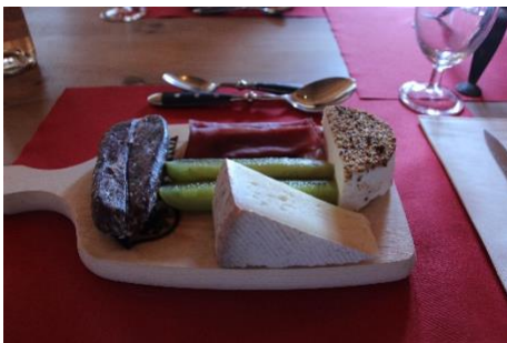
Le plättli avec les spécialités locales et le vin est excellent.

Enfin, le trajet en car nous a ramené à Coire jusqu'à la gare, d'où la plupart des gens rentrèrent à 17h30.