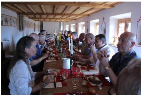
Notre repas sur les longues tables du château.

Ensuite, dans la grande salle du château, nous avons pu prendre un délicieux déjeuner avec des spécialités des Grisons: Bresaola, Ziger, Bergkäse et Salsiz avec du pain fumé très aéré. Nous avons beaucoup apprécié. Enfin, nous avons dégusté un délicieux dessert, un glacé et sa crème, le tout à la framboise.