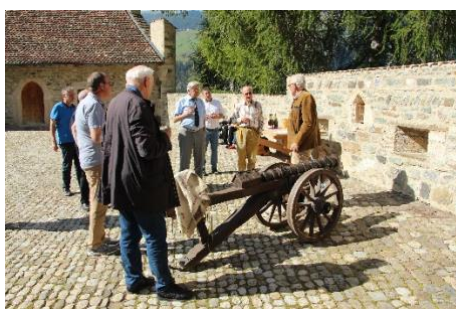
L'apéro au château Haselstein avec le seigneur du château et le canon original des guerres de Bourgogne

Le trajet nous ramèna à Coire dans la cour du château épiscopal. Le centre-ville était un peu encombré par le défilé de la Schlaggerparade qui avait lieu ce jour-là et par les nombreux chantiers.