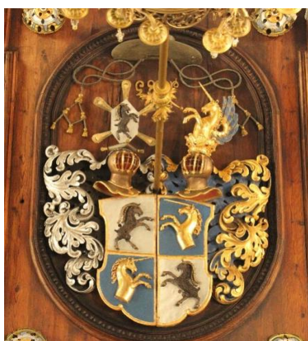
Plafond de la salle épiscopale des chevaliers, construite en 1663, Armoiries épiscopales d'Ulrich VI de Mont.