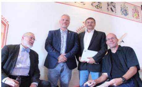
Notre Comité devant la frise aux armoiries des familles nobles des Grisons tirée du rouleau des armoiries de Zurich

Nous avons alors le temps d'inspecter l'ensemble de la tour. Nous y découvrons non seulement une vue grandiose depuis la terrasse supérieure mais aussi l'ancienne prison faite d'une cage en bois au sous-sol, ainsi que des détails artisanaux soigneusement conçus sur les poutres et les cheminées. Proverbes, armoiries et millésimes relatant les anciens propriétaires et les rénovateurs.