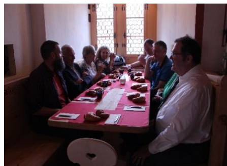
... de l'intérieur, un lieu de rassemblement et de fête moderne et confortable.