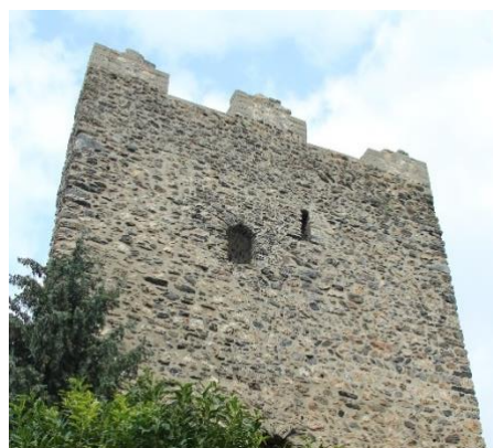
Château de Friedau: De l'extérieur, une tour médiévale ...