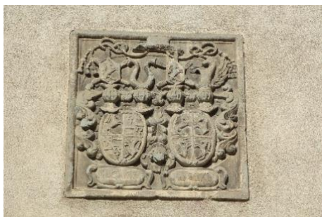
Armoiries épiscopales au-dessus de l'entrée latérale: Évêque Johann VI Flugi d'Asper-mont, 1637 et Évêque Ulrich VI de Mont 1663.